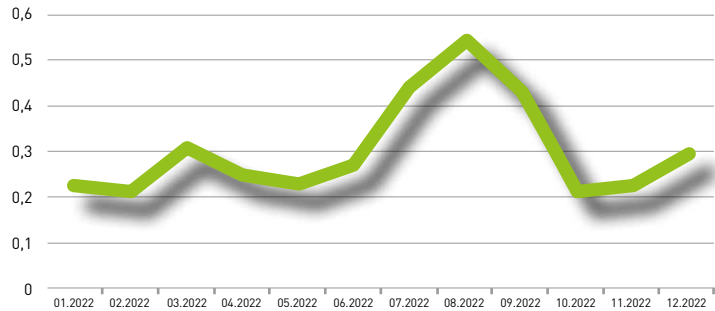
Grafico indice (12 mesi)