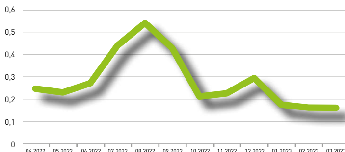
Grafico indice (12 mesi)